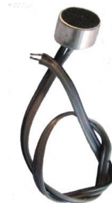
Kondenzátor mikrofon -DP3000 központhoz