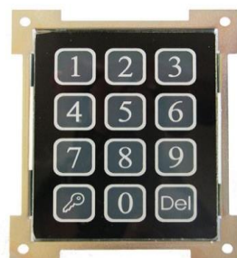
Számlap billentyűzet -DP3000 kaputelefon családhoz -Kétrétegű ragasztott üveg hátsó megvilágítású billentyűzethez