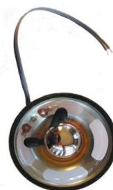
Hangszóró -DP3000 kaputelefon központhoz -55 mm átmérő -8 ohm, -0,5W