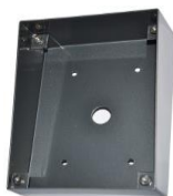
DP100 kódzárhoz esővédő *falra kívüli szerelésre

*Az esővédő kívül-belül szinterezett és UV álló lakkal bevont