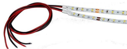
LED világítás -DP3000 központokhoz -Öntapadós rögzítés -12V DC, AC -10cm hosszú LED szalag, -30 cm vezeték