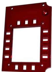
Bordó plexi DP3000 központhoz