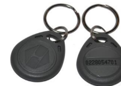
Proxi beléptető kulcstartó

Többféle színben Működési távolság 5-8 cm