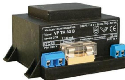
Transzformátor - 12V -30VA