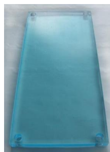
Védőplexi DP3000 és Codefon központokhoz - plexi a kis névtáblához - 178 x 76 mm - vastagság: 8 mm