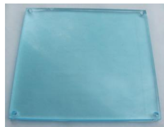
Védőplexi DP3000 és Codefon központokhoz - plexi a kezelőhöz - 178 x 178 mm - vastagság: 8 mm