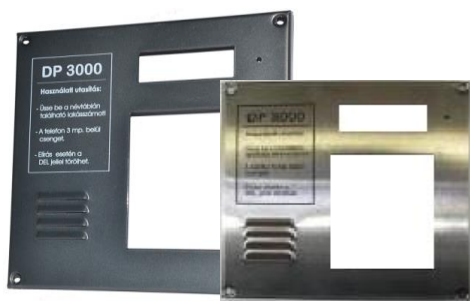
DP3000 központ előlap -Acéllemez kívül-belül szinterezve és lakkozva